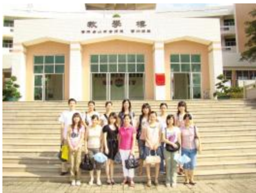
图是参加教育活动的我们在侨资项目前的合影

日前,本院组织我们即将走上医护岗位的一行10多人,进行岗前“爱国爱乡”教育活动,使我们接受了一次洗礼,感慨良多。这天,我们先后参观了鹏权中学和新宁