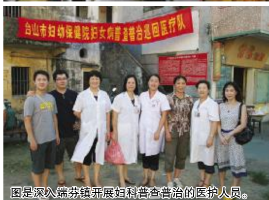
图是深入端芬镇开展妇科普查普治的医护人员。