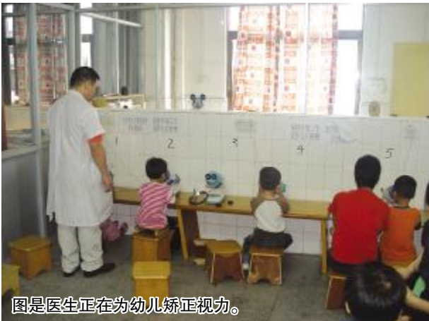
图是医生正在为幼儿矫正视力。

经常有些家长带着婴幼儿来诊,说孩子从出生后几天或稍后时间内双眼或单眼开始有明显的流泪,有时伴有不同程度的粘性或脓性分泌物。有些家长以为孩子有“眼热”,给予凉茶口服或局部滴眼药水,但孩子流泪的现象始终时好时坏,或日益加重。看着自己的孩子天天流泪,作为父母,一方面甚为不解,同时又为孩子的病症担心焦虑。