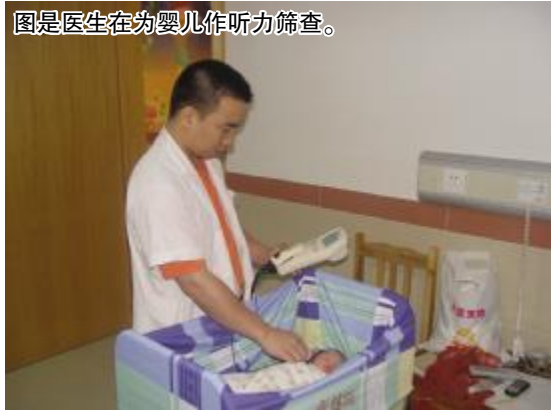
图是医生在为婴儿作听力筛查。

各位家长,为了下一代儿童的健康,请做到“早发现、早诊断、早干预”,为减少新生儿听力和语言残疾所造成的影响而努力,市妇幼保健院五官科咨询电话:5559345。(杨文辉/文)