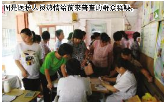
图是医护人员热情给前来普查的群众释疑。

认为吃得、做得就身体健康,但未发现隐藏在体内这样或那样的妇科病,往往到自我感觉不适时已太迟了,临床屡见不鲜,很可惜。针对此情况,市妇幼保健院组织一支有临床经验的医疗队伍,携带B超、化验等设备,每年2-3次到农村及边远的山区、海岛免费进行以防癌为主的妇科病普查普治,并查出一些子宫肌瘤、宫颈癌、内膜癌、乳腺癌及其它各种妇科病,及时给予治疗、跟踪,这样做既减轻了妇女的痛苦,又解决了妇女因经济困难看不起病或因各种原因无法往医院检查的实际困难,深受广大群众的欢迎。