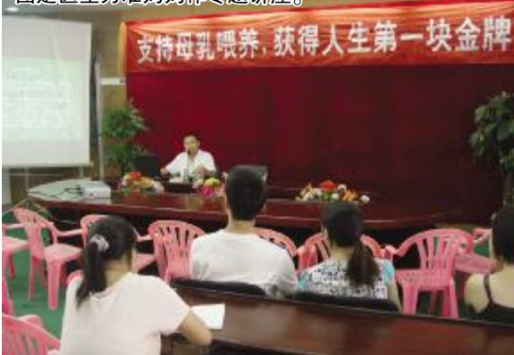
图是医生为准妈妈作专题讲座。