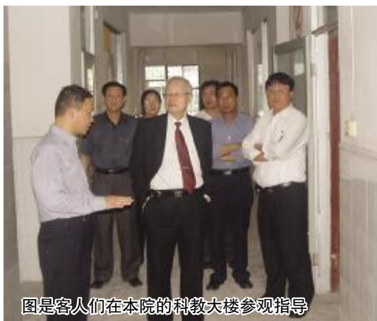
图是客人们在本院的科教大楼参观指导

在参观中,客人们高度评价本院科教大楼的基础建设情况。他们说,医院这几年呈现非常良好的发展态