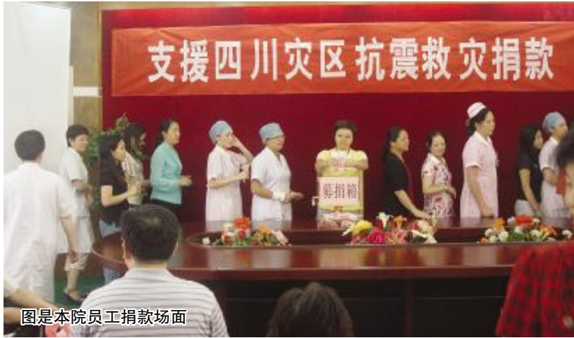
图是本院员工捐款场面