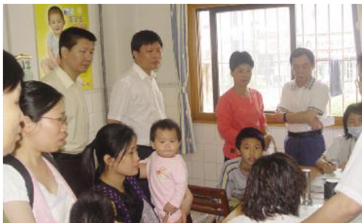
图是上级领导在儿科检查指导工作

【本报讯】 江门市政府副秘书长梁启华(后排左二)和江门市卫生局副局长蓝敏雄(后排左一),于2008年5月13日到本院指导手足口病防治工作。他们听取我院领导及专科医生有关手足口病的防治情况介绍,对本院在防治儿童手足口病的工作表示赞赏,并在本院开设了宣传专题,传授手足口病的防治知识,还对今后这方面的工作提出了具体的指导性意见。